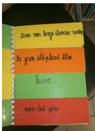
La Fabrique à histoires, livre réalisé par les CM1