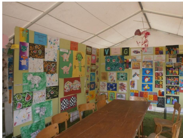
Vue du chapiteau à l'extérieur de la bibliothèque (exposition des réalisations faites en classe et quiz de la bibliothèque)