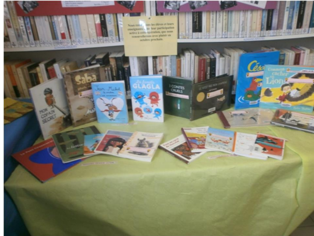
Présentation de l'opération Livrentête