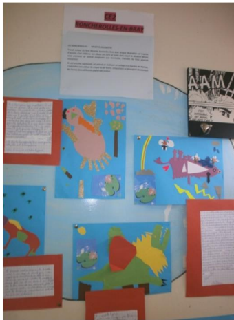
Collages réalisés par les CE2 à la manière de Matisse